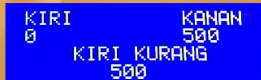
*ilustrasi user interface